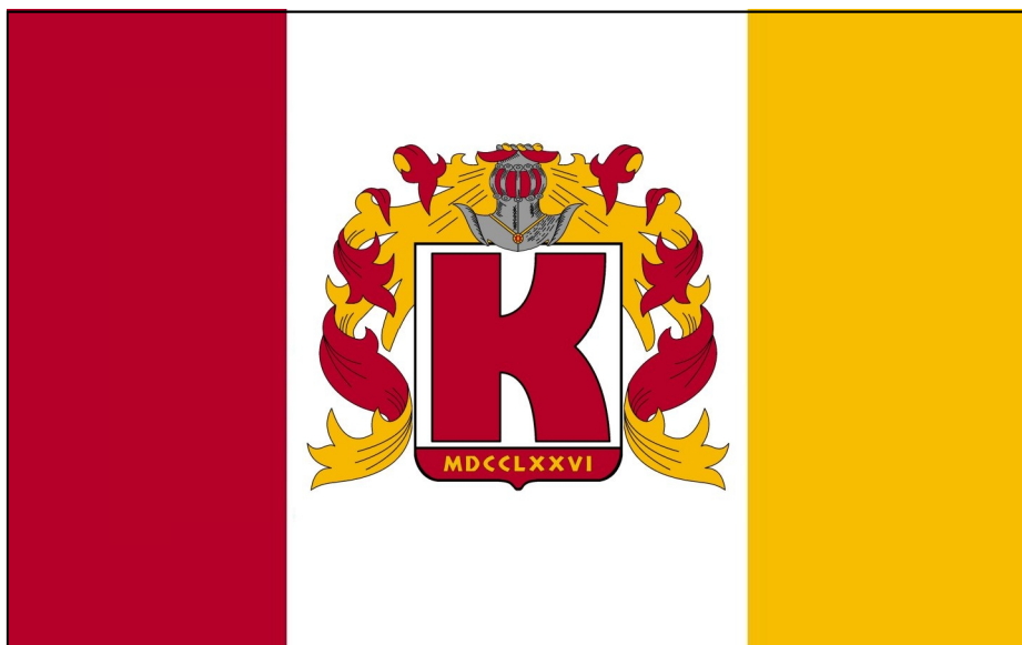
Egen påhittad flagga med det lika påhittade släktvapnet i mitten!